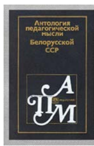
Мал. 2. Выданне па гісторыі педагогікі