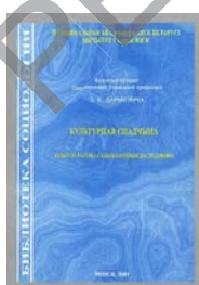
Мал. 3. Выданне па культуралогіі