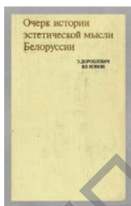
Мал. 1. Сумеснае выданне з У. Конанам