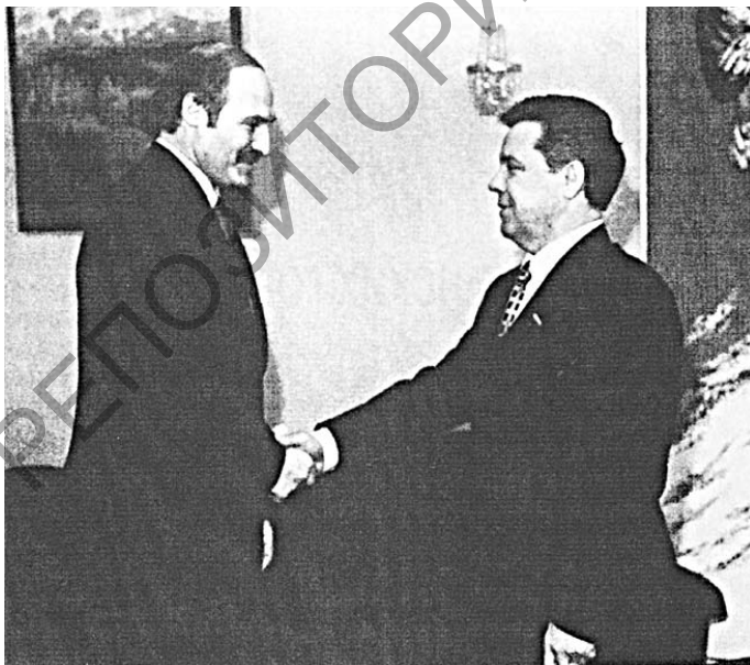
Президент Республики Беларусь А.Г. Лукашенко и Генерал Б.В. Громов. 9 февраля 1998 г.

Заметим, что внешне Б. Кармаль проявлял активность, участвовал в проводимых съездах и конференциях, встречался с представителями различных слоев населения как в столице, так и в провинциях, уездах, выступая на митингах с разъяснением политики партии [2, с. 69].