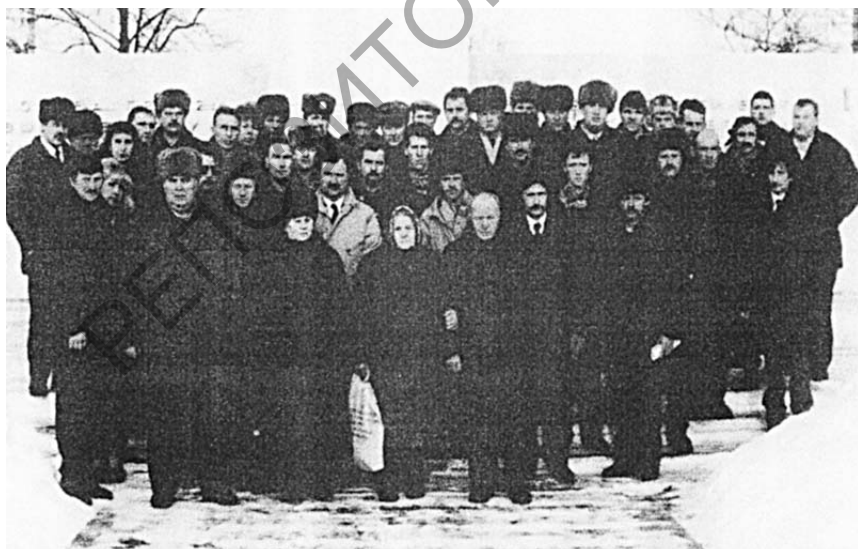
Встреча воинов-интернационалистов Смолевичской районной организации