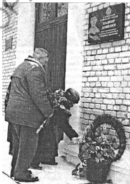
Урачыстае адкрыццё мемарыяльнай дошкі ў Прылепскай СШ