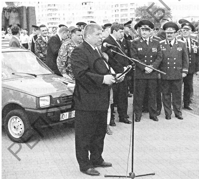
Вручение воинам – «афганцам» автомобилей «Ока» на Острове Мужества и Скорби

Вывод из участия в тех вооруженных конфликтах сделан верный: впредь ни один гражданин республики воевать на чужой земле не будет: нечего делать им в разных «горячих» точках. Эту решимость не однажды высказывал Президент Беларуси Александр Лукашенко.