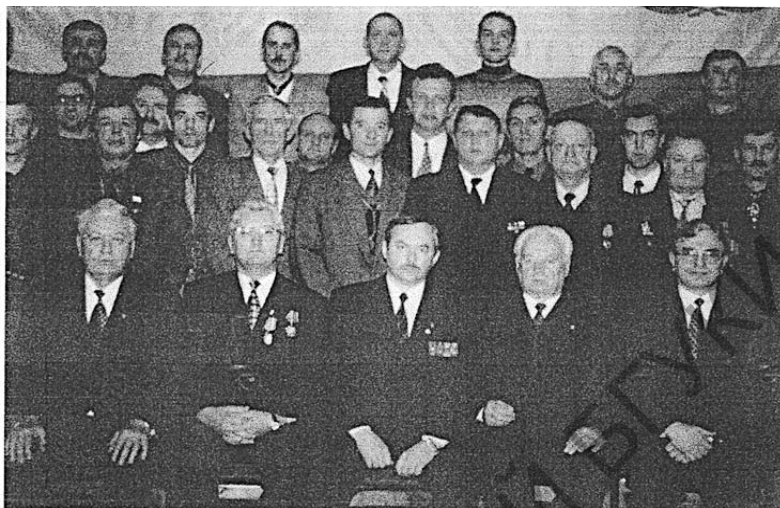
Встреча в Минском облисполкоме ветеранов войны в Афганистане (15 февраля 2000 г.)