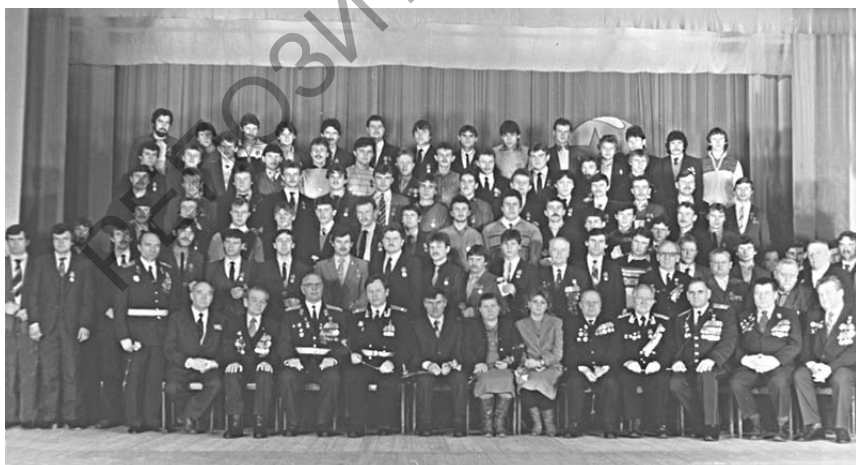
Награждение медалями «70 лет ВС СССР» 1988г.