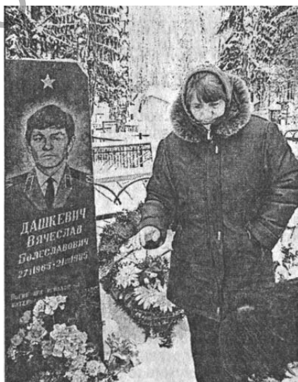
У могилы Вячеслава Дашкевича