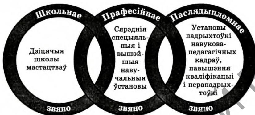
Сістэма бесперапыннай адукацыі ў сферы мастацтва

У Рэспубліцы Беларусь склаўся станоўчы вопыт у падрыхтоўцы кадраў для галіны культуры, склалася ўстойлівая сістэма бесперапыннай адукацыі ў сферы мастацтва.