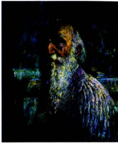
М. Чураба. У сваёй майстэрні.

рэнняў (паляпшэнне культуры земляробства, арганізацыя саматужных арцеляў і перасяленняў) разам з захаваннем памешчыцкага землеўладання і сям. абшчыны. Аўтар падручнікаў па статыстыцы, прац па палітэканоміі, агр. пытаннях, чыг. гаспадарцы («Чыгуначная гаспадарка», т. 1—2, 1875—78; «Пра характар і прычыны сучаснага прамысловага крызісу ў Заходняй Еўропе», 1889; «Пра эканамічнае значэнне адукацыйных і выхавальных устаноў для рабочага класа», 1898, і інш.). Адзін з рэдактараў і аўтараў зб. «Уплыў ураджаяў і хлебных цен на некаторыя бакі рускай народнай гаспадаркі» (1897). Н.К.Мазюка.