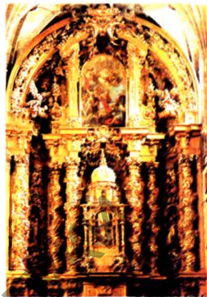
Да арт. Чурыгера. Х.Б. дэ Чурыгера. Рэ-табла касцёла Сан-Эстэбан у г. Саламанка. 1693—96.

Літ.: Актеры советского кино. Вып. 7. М., 1971.