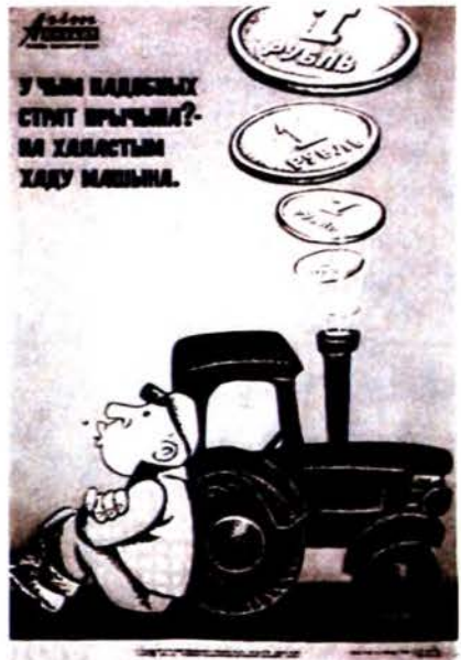
Л.Чурко. Агітплакат. 1971.

ЧУРКО Юлія Міхайлаўна (н. 21.7.1936, С.-Пецярбург), бел. балерына, мастац.