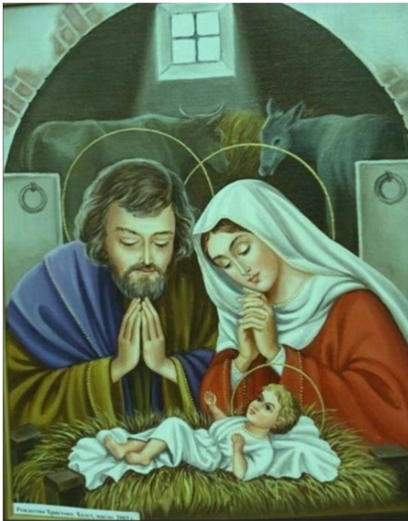
Рис. 1. Ядвига Сенько. «Рождество Христово». 2003 г., холст, масло