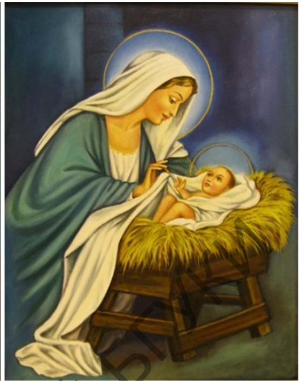
Рис. 2. Ядвига Сенько. «Рождество Христово». 2003 г., холст, масло