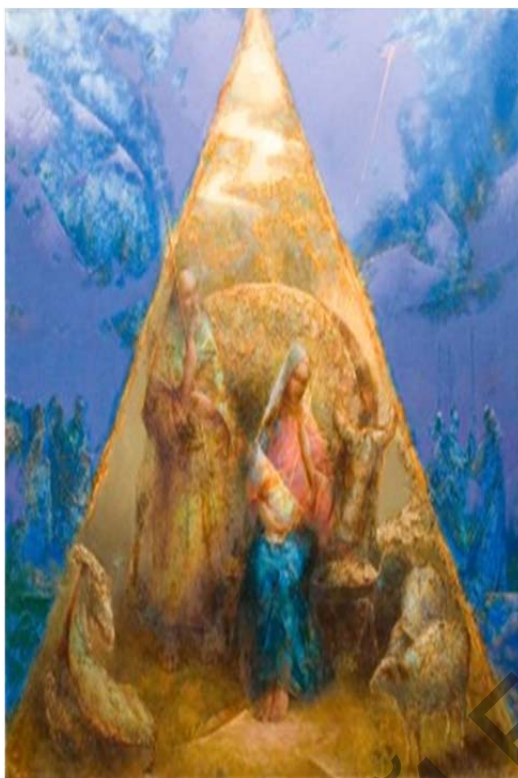
Рис. 5. Сергей Шемет. «Рождество Христово». Холст, масло.