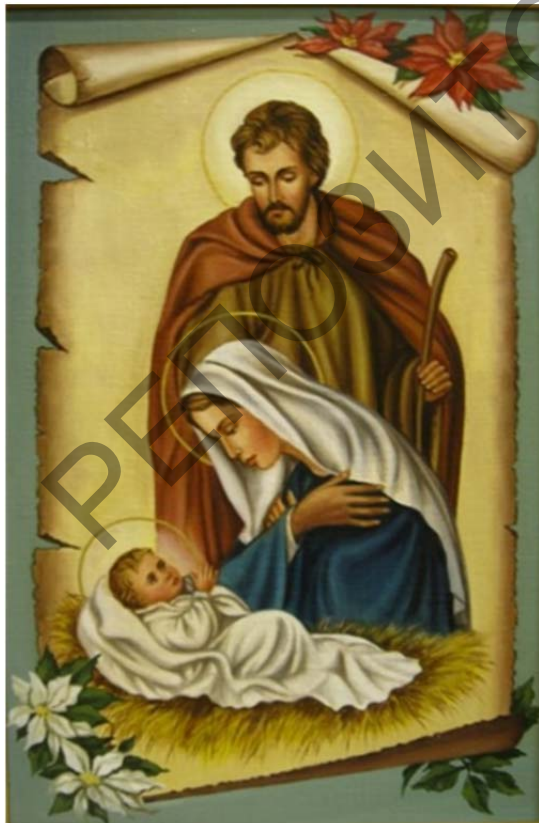
Рис. 3. Ядвига Сенько. «Рождество Христово». 2003 г., холст, масло