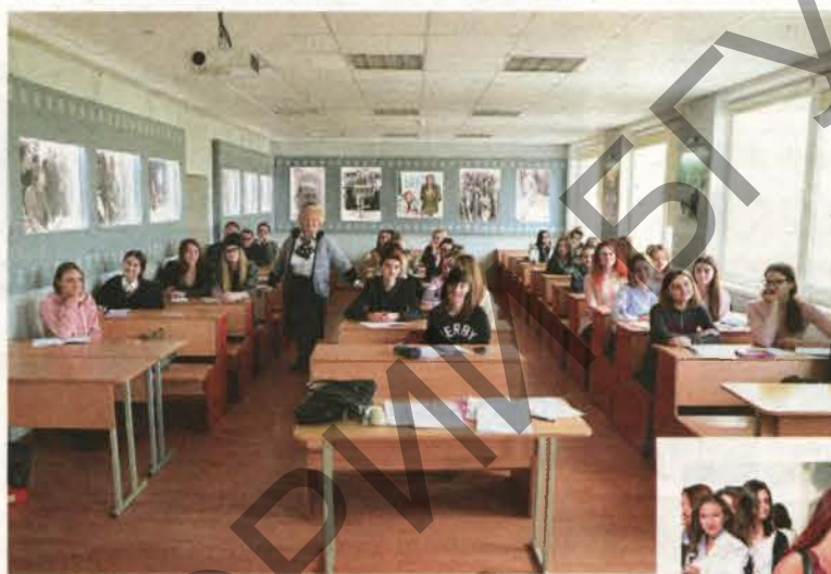
Студэнты БДУКіМ на занятках і пасля іх.

або Чым сёння жывуць ВНУ сферы культуры?