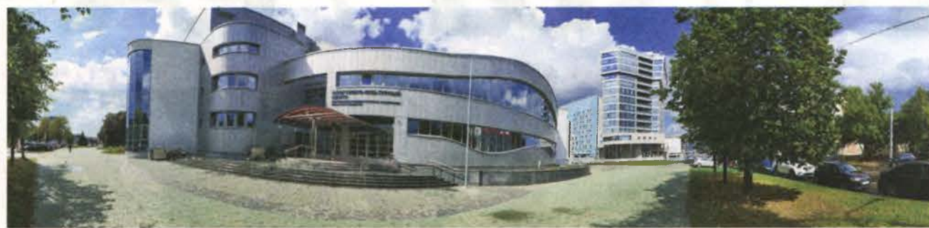
Новы спартыўна-культурны цэнтр Беларускага дзяржаўнага ўніверсітэта культуры і мастацтваў.

Наведаць выставу можна ў галерэі "Мабільная" да 1 лістапада.