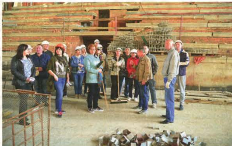
Выкладчыкі і студэнты ўніверсітэта падчас суботніка.

— У нас ужо ёсць вялікія планы на выкарыстанне гэтай пляцоўкі: ад арганізацыі на яе базе адукацыйнага працэсу (заняткаў па фізічнай культуры, практычных заняткаў творчых кафедраў факультэта музычнага мастацтва і факультэта традыцыйнай беларускай культуры і сучаснага мастацтва) да рэалізацыі новых творчых праектаў рознай накіраванасці, — кажа Дзмітрый Купрыянюк. — Гэта будзе самым галоўным падарункам для нас у гэтым годзе!