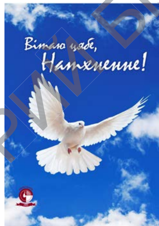
Вітаю цябе, Натхненне! матэрыялы па стылістыцы і культуры маўлення / уклад.: А. Багамолава [і інш.]. – Мінск: БДУКМ, 2015. – 138 с.

На пасяджэннях «БУКета» студэнты і выкладчыкі зачитваюць і абмяркоўваюць творы, наладжваюць палеміку, рыхтуюць тэарэтычныя паведамленні, прысвечаныя цікавым літаратурным з'явам і працэсам, новым літаратурным жанрам, формам, арыгінальным вобразам і г. д. Вершы і апавяданні студэнтаў з'яўляюцца пачаткам далейшай складанай працы, абавязковы элемент якой – літаратурная вучоба, знаёмства з творчай пісьменніцкай лабараторыяй. Маладыя літаратары спрабуюць сябе ў розных мастацкіх жанрах, шукаюць сродкі выказаць асабістыя перажыванні, пачуцці з да-