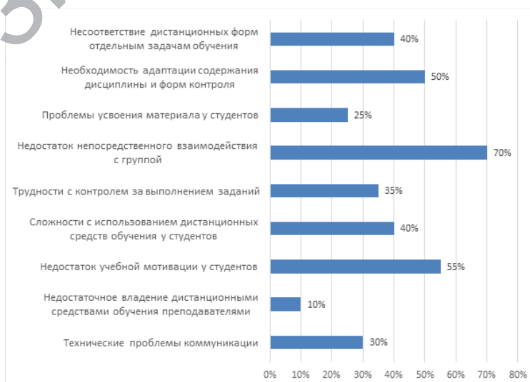
Рис. 2. Сложности, с которыми столкнулись преподаватели при использовании дистанционных средств обучения

При оценке результатов перехода на дистанционное и смешанное обучение во время пандемии в 2019/20, 2020/21 учебных годах ответы распределились в основном между вариантами «результаты не изменились» (40 %) и «результаты ухудшились» (40 %). Только 10 % отмечают достижение более высоких образовательных результатов. При ответе на вопрос: «С какими сложностями Вы столкнулись при использовании дистанционных средств обучения?» – 70 % респондентов отметили недостаток непосредственного взаимодействия с аудиторией, 55 % – снижение учебной мотивации у студентов, 50 % – необходимость адаптации содержания учебных дисциплин и форм контроля, 40 % – несоответствие дистанционных форм отдельным задачам обучения. 40 % респондентов столкнулись с проблемами использования дистанционных средств обучения у студентов, 30 % – в целом с техническими проблемами коммуникации, затрудняющими образовательный процесс (рис. 2). Анализ полученных данных позволяет оценить опыт перехода на дистанционный и смешанный формат скорее позитивно, поскольку большая часть указанных сложностей и проблем преодолима при условии освоения новых цифровых технологий студентами и преподавателями и запланированных общих процессуальных изменений в образовательном процессе.