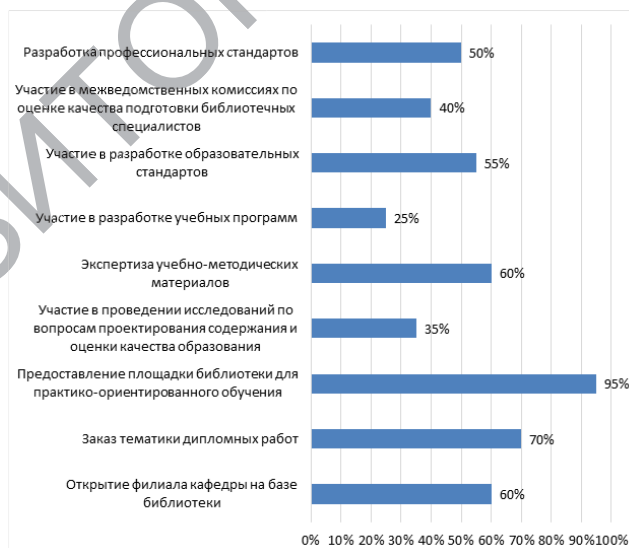
Рис. 4. Мнение преподавателей о наиболее продуктивных формах влияния работодателей на содержание библиотечно-информационного образования

Результаты анкетирования позволяют подтвердить ощутимо возросшую потребность в практико-ориентированном обучении: 85 % преподавателей считают необходимым увеличение доли занятий, которые должны проходить на базе библиотек, при том что общее количество таких занятий с каждым годом неуклонно растет. Данная позиция подтверждается результатами ответов на вопрос: «Какие формы влияния работодателей на содержание библиотечно-информационного образования Вы расцениваете как наиболее продуктивные?» 95 % респондентов считают приоритетным «предоставление площадки библиотеки для практико-ориентированного обучения» (рис. 4).