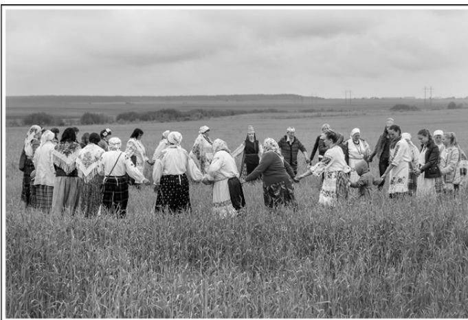
Мал. 2. Карагод «Ваджэння і пахавання стралы» ў полі, в. Стаўбун, 2017.

З падачы беларускага этнамузыкалага і антраполога, доктара мастацтвазнаўства Зінаіды Мажэйкі (1933–2014) выраз «аўтэнтчны фальклор» трывала ўвайшоў у айчынную гуманітарную навуку [3, с. 11]. Асобы, якія працуюць у галіне фіксацыі і перадачы моладзі народнага мастацтва Беларусі, заўсёды арыентаваліся на каштоўнасці і эстэтыку праяў айчыннага фальклору, што існуюць у «жывым» бытаванні, перадаюцца вусным шляхам «ад майстра да навучэнца» (а таму з’яўляюцца аўтэнтчнымі), паколькі ўплыў ад такіх праяў асабліва моцны і плённы для творчасці. Уражанні ад сапраўднага мастацтва спрыяюць духоўна-творчаму станаўленню асобы – працэсу набыцця духоўна-творчых якасцей, якія ахопліваюць кагнітыўную, экзістэнцыйна-эмацыйную і паводзінную сферу асобы, а таксама наступнае разгортванне на іх аснове адпаведнага крэатыўнага патэнцыялу чалавека.