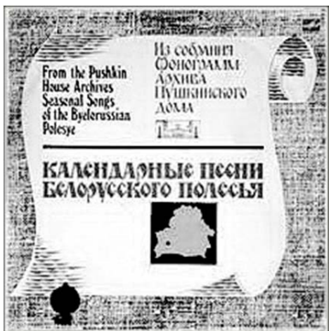
Мал. 1. Вінілавы дыск «Календарныя песні Беларускага Полесья», 1983