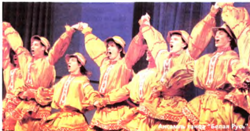
Ансамбль танца “Белая Русь”.

Стаячы вітала публіка двух маленькіх паветраных гімнастаў узорнай студыі цыркавага мастацтва “Арэна” з Мазыра. Іх выступленне працягвалі іншыя студыйцы, сярод якіх быў і больш старэйшы гімнаст, які не ўзятаў, падхоплены стужкамі, а засяроджана падзіў “лесвіцу да нябёсаў”, ставячы адзін табурэт на другі і дэманструючы на версе кожнага з “навабудаў” чарговую “жывую скульптуру” свайго трэніраванага цела. Раптам падумалася: якая мастацкая алегорыя формулы творчага поспеху! Бо талент — гэта не толькі ўзлёт на хвалі натхнення, але і ўпартая штодзённая праца, без якой узыходжанне змяняецца рэзкім з’ездам уніз.