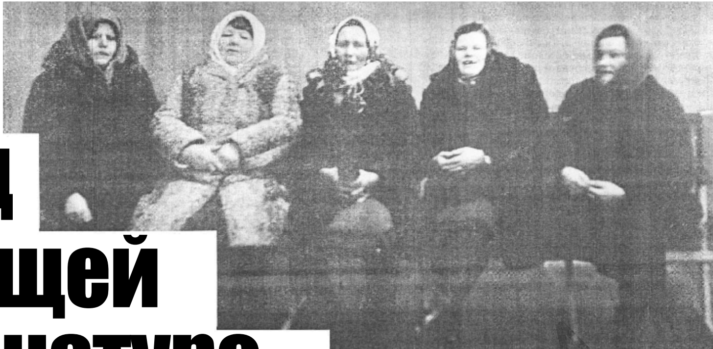
Бабушки из Полоцкого района, заснятые в 1980-е годы, кое-что успели напеть этнографам. Но большую часть репертуара унесли с собой...

Н аш фольклор живуч. Несмотря на самые пессимистические прогнозы, в деревнях еще поют песни, слова и мелодии которых уходят корнями в глубь веков. Однако источники народного творчества могут иссякнуть. И где потом услышишь оригинальную музыку, в которой черпали вдохновение «Песняры» Мулявина?