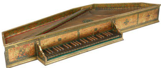
Рисунок 3 – Вирджинал Дж. Баффо, 1594 г. Венеция

Инструмент имеет пятиугольную форму (т.н. пентагональный вирджинал) и небольшую клавиатуру, смещенную влево (рис. 3). Для изготовления использовалась типичная для итальянских клавирных инструментов древесина кипариса. Корпус вирджинала искусно расписан, использовалась техника золочения. Натуральные клавиши облицованы древесиной черного дерева, а хроматические украшены геометрическим орнаментом, который характерен для чертозианской мозаики. Резонирующие отверстия украшены розетками из пергамента [3, с. 785].