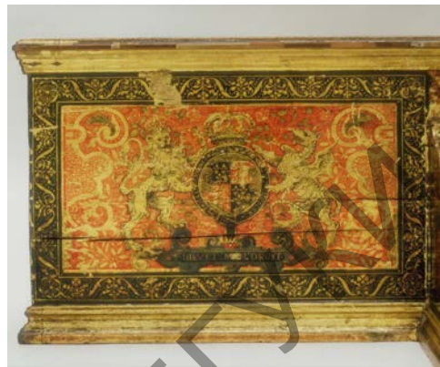
Рисунок 4 – изображение на корпусе королевского герба Тюдоров

О том, что вирджинал был предназначен для английской королевы Елизаветы I, свидетельствует изображение на корпусе инструмента королевского герба. Он представляет собой щит, который с одной стороны поддерживает коронованный лев, а с другой – валлийский дракон, символ династии Тюдоров, указывающий на их кельтское происхождение (рис. 4). Кроме того на корпусе присутствует изображение сокола, держащего в лапе скипетр – гербовый знак рода Анны Болейн, матери Елизаветы I.