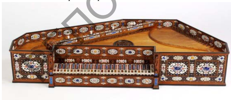
Рисунок 1 – Вирджинал А. Росси, 1577 г Милан

Коллекция включает в себя небольшое количество (более 20 экспонатов) клавесинов, клавикордов, вирджиналов и спинетов, созданных в период с XVI по XX вв. ведущими западноевропейскими мастерами. Старейшими инструментами в коллекции являются вирджиналы миланского мастера Аннибале Росси (1542–1577 гг.). Инструмент 1577 г. является последним среди инструментов, сконструированных итальянским мастером. Корпус вирджинала имеет семиугольную форму (рис. 1). Сохранившиеся источники свидетельствуют о том, что Росси первых среди мастеров придумал такой вид модели корпуса [3, с. 784]. Вирджинал является редким образцом богатого декорирования драгоценными камнями. Для украшения корпуса были использовано около двух тысяч драгоценных и полудрагоценных камней, в том числе бирюза, жемчуг, ляпис-лазурь, гранат, изумруды и др. Роскошное оформление дополняют украшения из ценных пород древесины (самшит, черное дерево) и слоновой кости (рис. 2). Клавиши облицованы яшмой и ляпис-лазурью, слоновой костью и черным деревом.