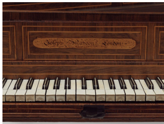
Рисунок 6 – фрагмент клавиатуры спинета, облицовка хроматических клавиш «хвост скунса»

Клавирный мастер Джозеф Махун (Joseph Mahoon, 1729–1773 гг.) был одним из известных английских мастеров середины XVIII в. Его клавесин изобразил великий художник У. Хогарт на одной из своих картин из цикла «Похождения повесы» (или «Карьера мота» «The Rake's Progress») (1735 гг.) [5]. Спинет этого мастера из коллекции музея является типичным для английских инструментов примером более сдержанного